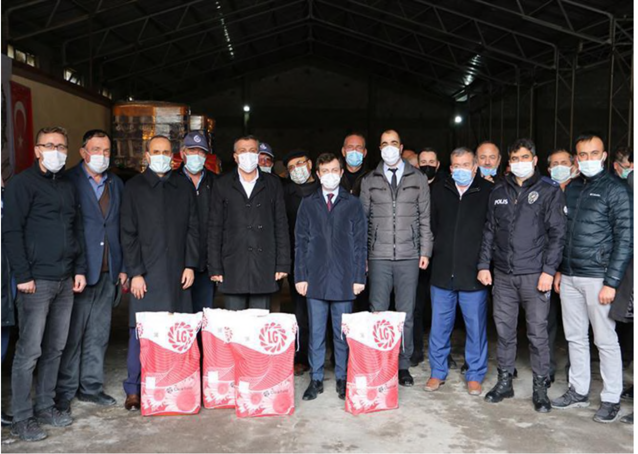
Yağlık Ayçiçek Tohumluğu Dağıtımı