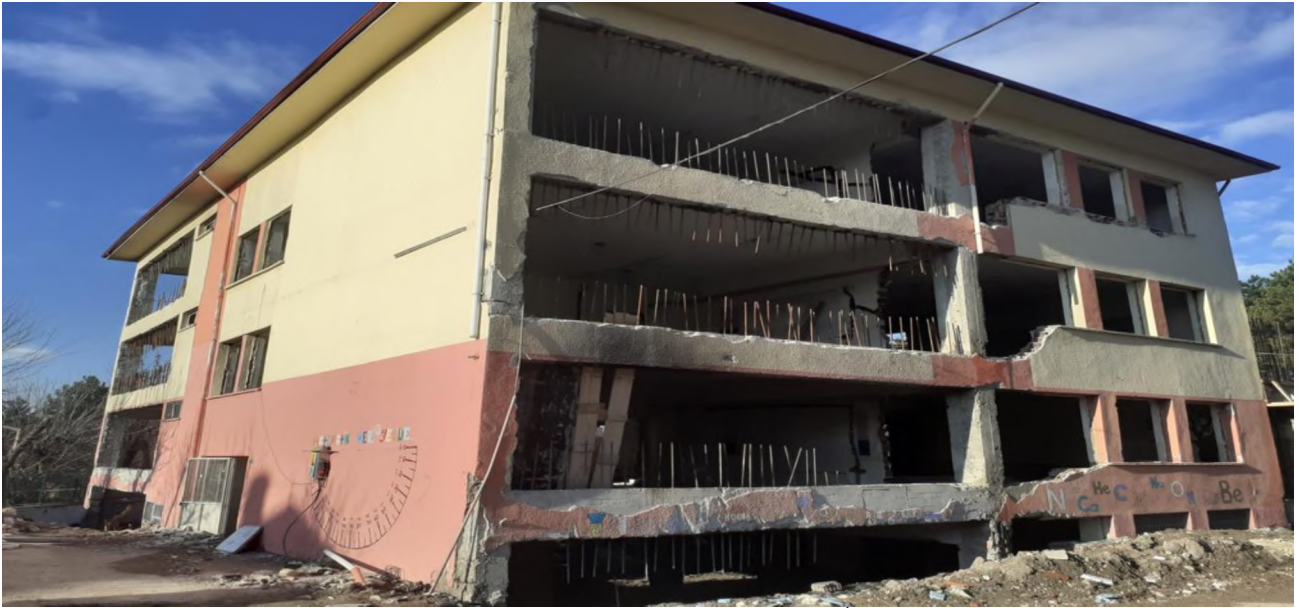
Bolu Merkez Sakarya Ortaokulu Güçlendirme ve Onarım İşi