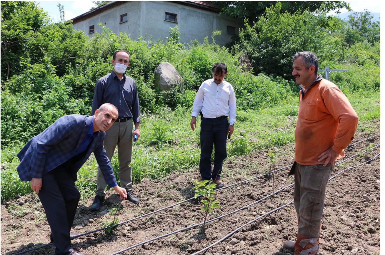
Ahududu Bahçesi Kurulumu