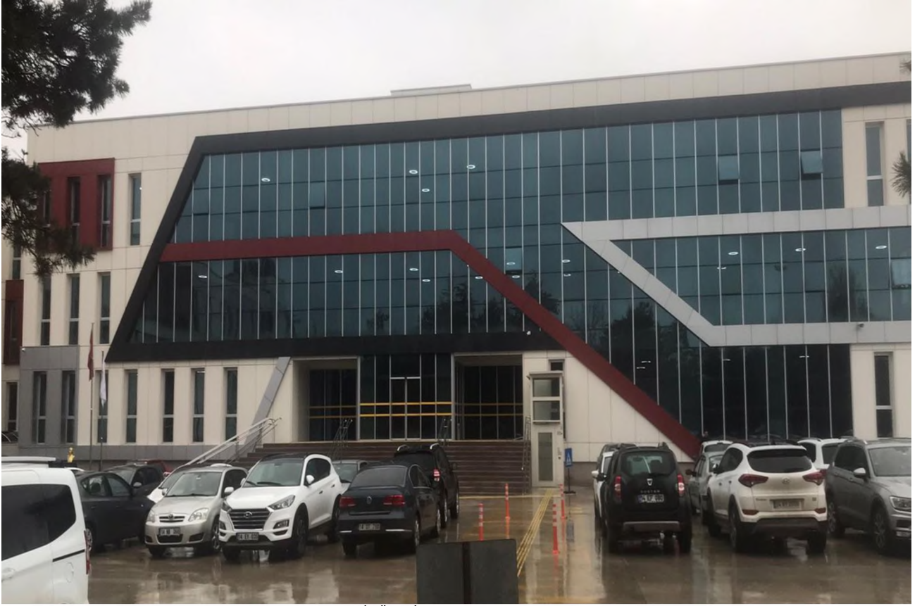
Bolu İl Özel İdaresi Ek Hizmet Binası