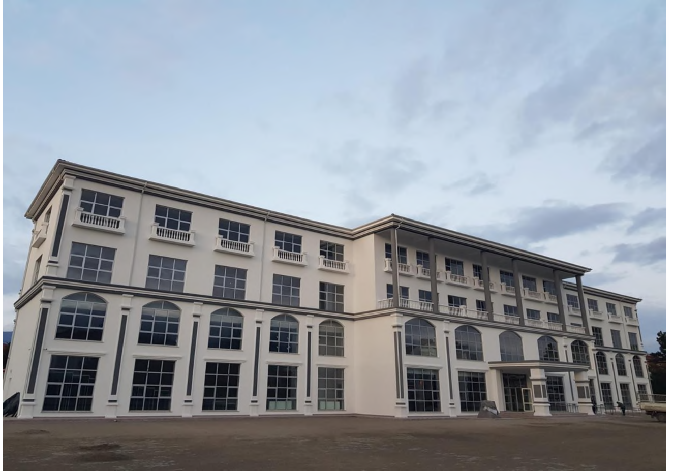
İl Milli Eğitim Müdürlüğü Binası