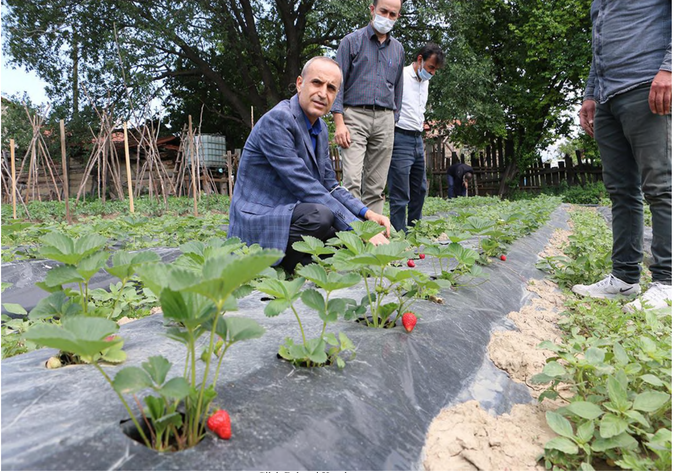
Çilek Bahçesi Kurulumu