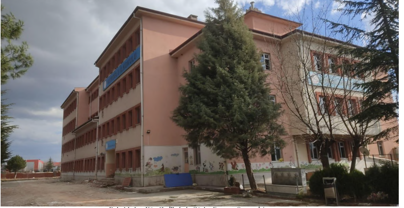
Bolu Merkez Koroğlu İlkokulu Güçlendirme ve Onarım İşi