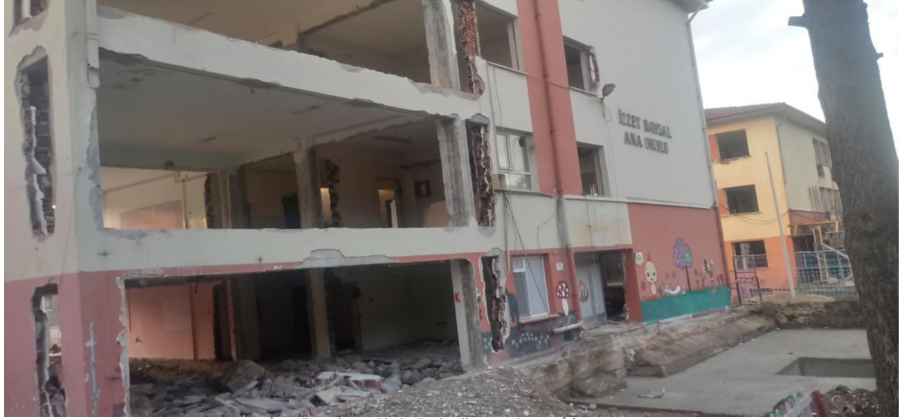
İzzet Baysal Ana Okulu Güçlendirme ve Onarım İşi