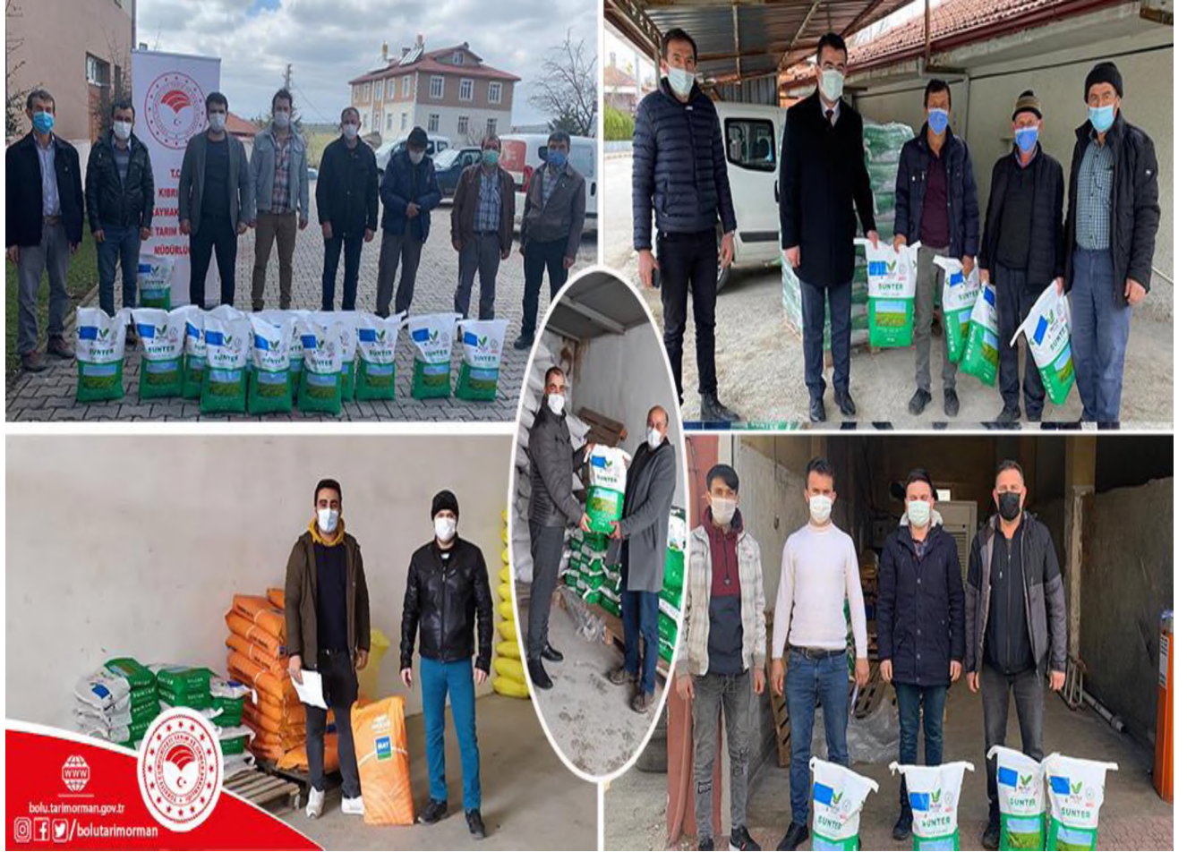
Yonca Tohumluğu Dağıtımı

Kıbrısçık İlçemizde 23 çiftçimize 650 kg Kıbrısçık Karakılçık çeltiği dağıtılmıştır.