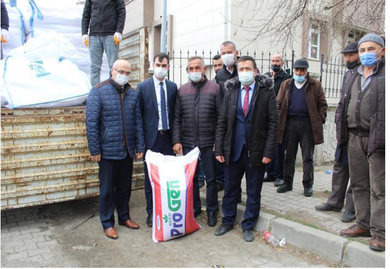
Arpa Tohumluđu Dađıtımı