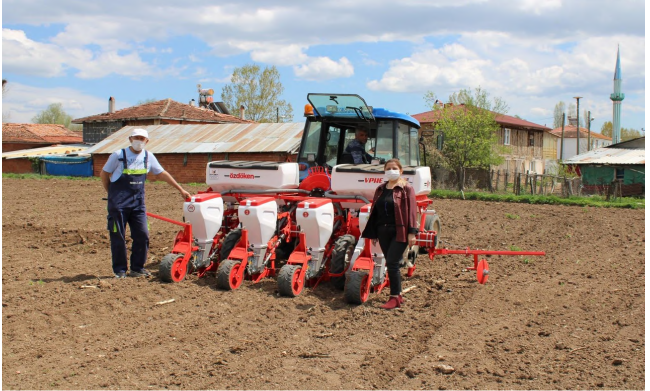
Yeniçağa Pnömatik Mibzer Alımı

%100 Özel İdare desteği ile Yeniçağa İlçemize pnömatik mibzer alımı gerçekleştirilmiştir.