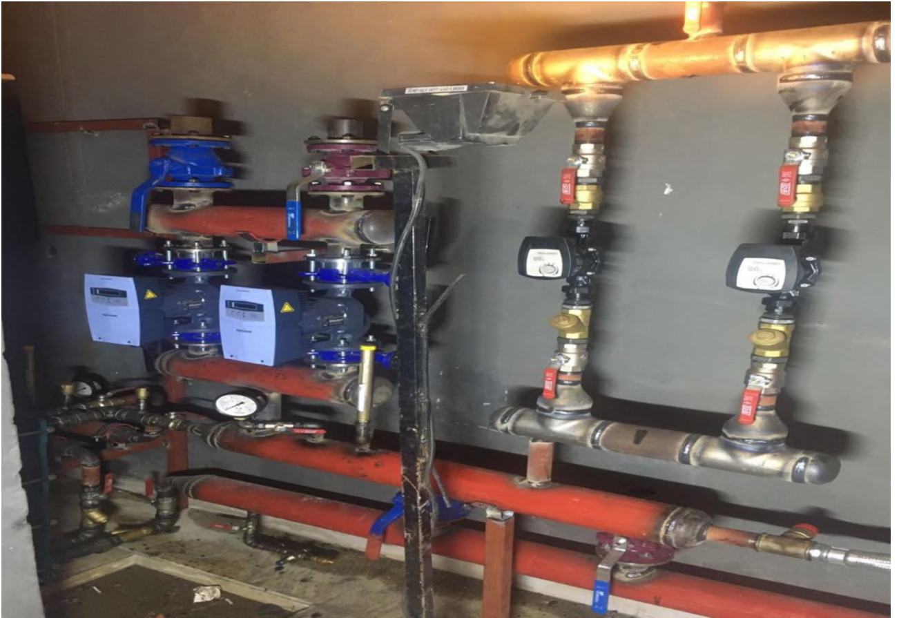
Dörtdivan İlçesi Hükümet Konağı Doğalgaz Dönüşüm İşi