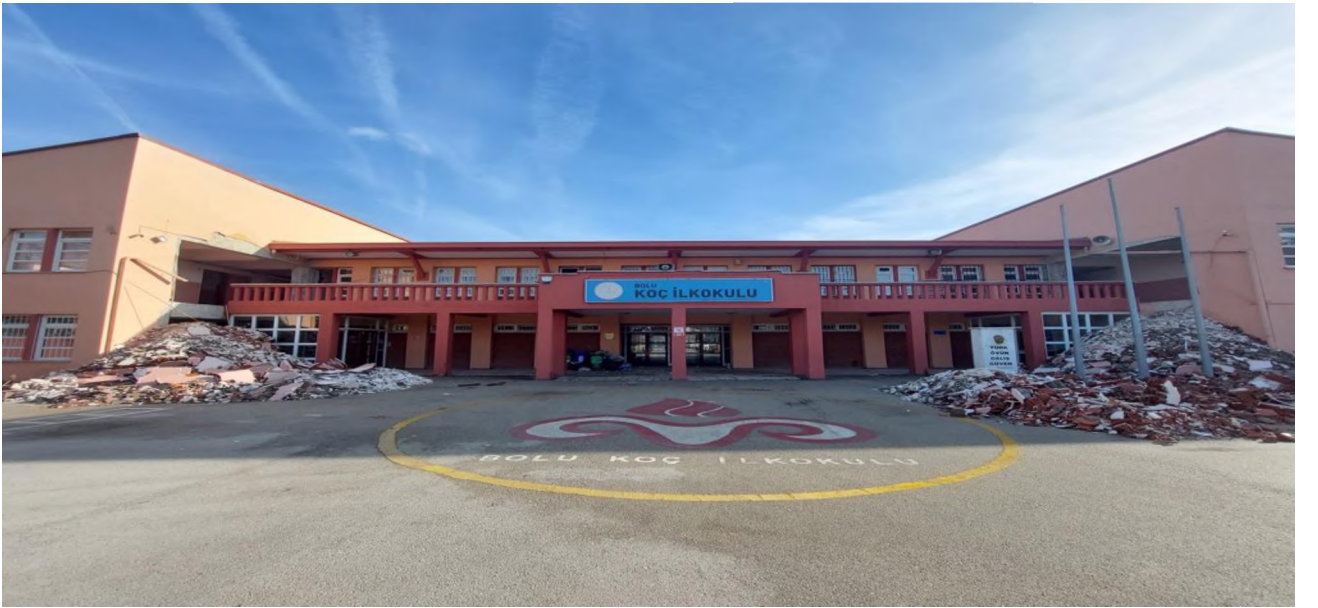
Bolu Merkez Koç İlkokulu Güçlendirme ve Onarım İşi