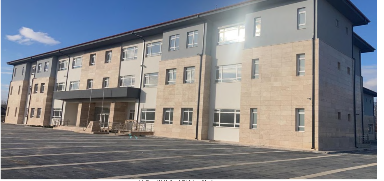
12 Derslikli Özel Eğitim Okulu