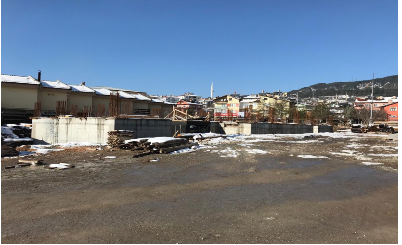
Gerede Hükümet Konağı Yapım İşi