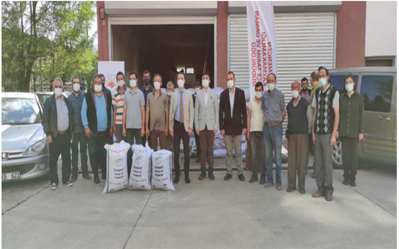
Macar Fiği Tohumluğu Dağıtımı

%75 Özel İdare desteği ile; Gerede, Dörtdivan, Yeniçağa, Mengen, Seben ve Kıbrısçık İlçelerimize toplam 55.000 kg macar fiği tohumluğu dağıtılmıştır.