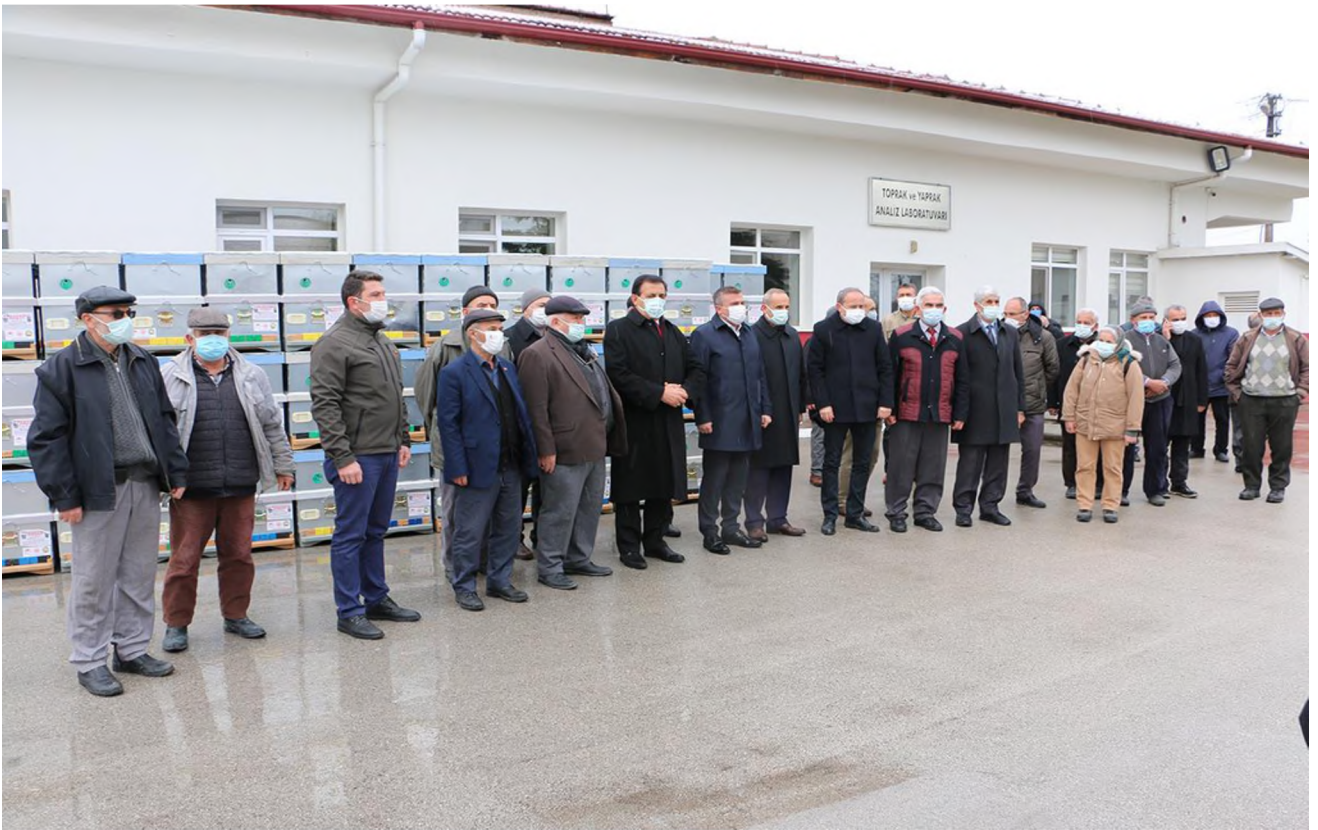
Modern Kovan Dağıtımı