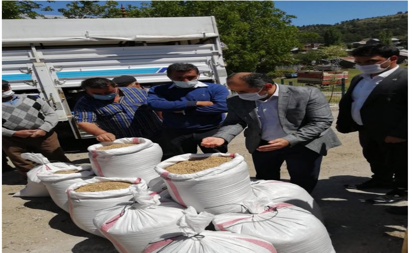
Kıbrısçık Karakılçık Çeltiği Dağıtımı

Kıbrısçık İlçemizde 23 çiftçimize 650 kg Kıbrısçık Karakılçık çeltiği dağıtılmıştır.