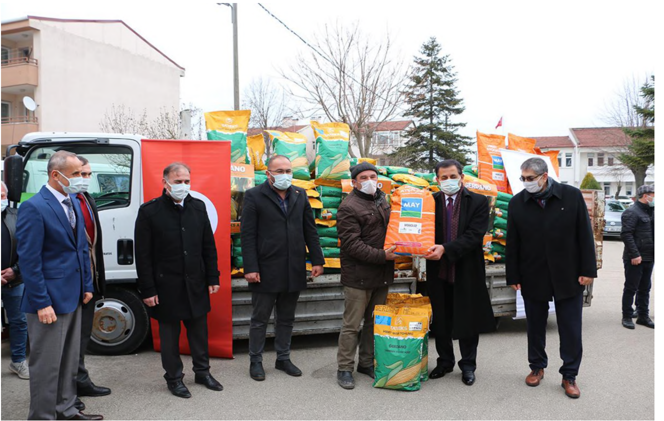
Dane Mısır Tohumluđu Dađıtımı